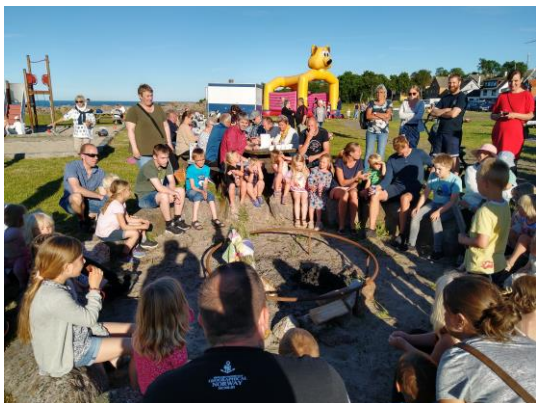
Sct. Hans børnebål