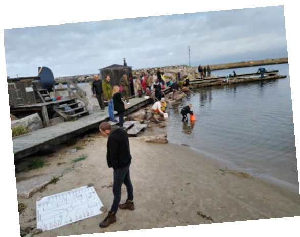
Vi høster på Tejn Havn